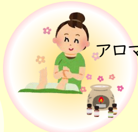
アロママッサージ